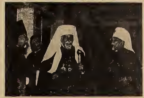
"Я вітаю Вас як брата українця і християнина."