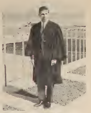
Yorkton Collegiate, Winnipeg, 1963

ТАК ХОЧЕТЬСЯ, АНДРІЮ, ЩЕ ПОСМІЯТИСЬ, НАВІТЬ