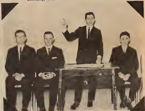
Debating Club, Yorkton Collegiate, Winnipeg, 1961