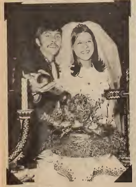
Winnipeg, March 1970