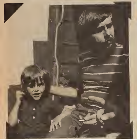
Moroz Hunger Strike