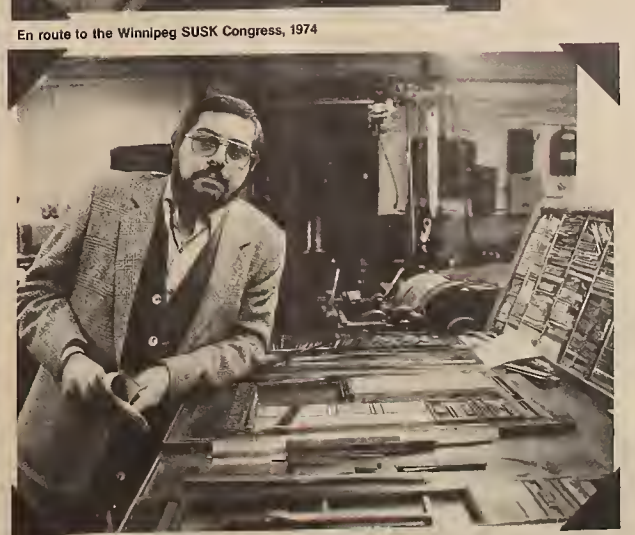
Ukrainian Echo, Toronto, 1983