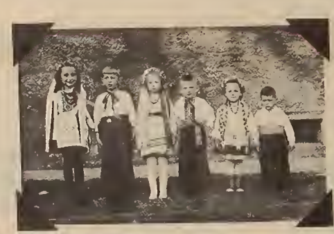
Mittenwald, Germeny, 1950