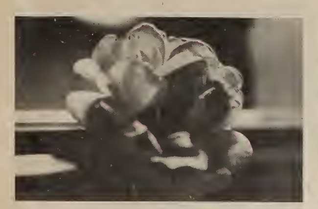
The Summer of 1984